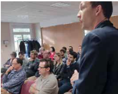
Le cabinet e-care a organisé un temps d'échange avec ses clients, sur la thématique de la Responsabilité Sociétale des Entreprises.

Fin novembre, le cabinet d'expertise-comptable basé à Chartres-de-Bretagne « e-care » a organisé pour ses clients un cocktail sur la thématique de la Responsabilité Sociétale des Entreprises. Pour ces experts, il s'agit « d'un enjeu stratégique, source de performance de manière globale et de durabilité ».